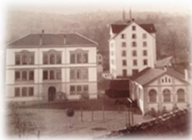
Ansicht ca. 1900