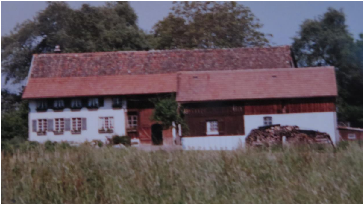
Schürli mit ehemaligem Waschhaus, 1983