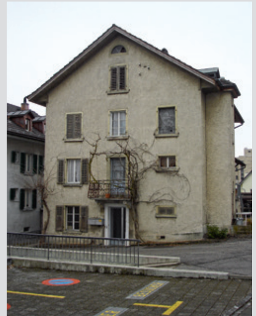
Die Liegenschaft an der Glarnerstrasse 37 kann infolge Unbewohnbarkeit seit 2010 nicht genutzt werden.

Das Projekt und die Kosten von CHF 1.286 Mio beruhen auf einem Vorprojekt und haben gemäss SIA Honorarordnung 102 eine Kostengenauigkeit von +/- 15%.